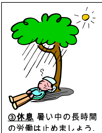
③休息 暑い中の長時間の労働は止めましょう。

人間の身体の60~80%は水分です。10~15%の水分を失うと生命に危険が及びます。乳幼児ほど、新陳代謝が激しいため、水分が無くなりやすいです。その結果、大人より早く脱水症状を来します。