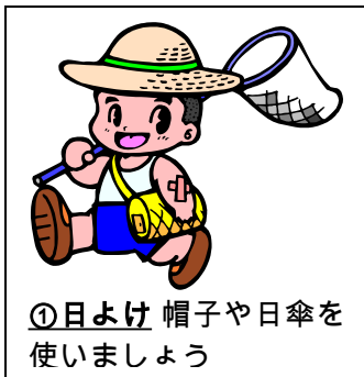
①日よけ 帽子や日傘を使いましょう